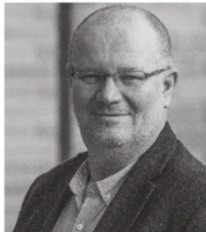
Szerző: DÉNES FERENC sportközgazdász